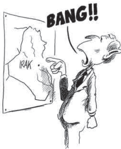
Die alte Strategie

Felgen, von lärmenden Trucks und PKWs amerikanischer Bauart, Marke Schlachtschiff, dazu zahlreiche Busse jedweder Couleur. Sie alle rasen um die Wette, die Hupe wird ausgiebigst und selbst bei geringsten Anlässen genutzt und Vor- und Rücksicht-