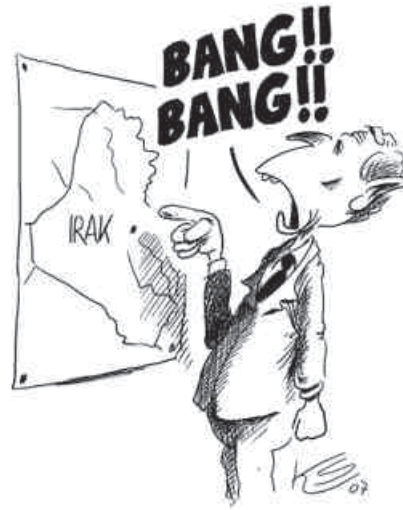
Die neue Strategie