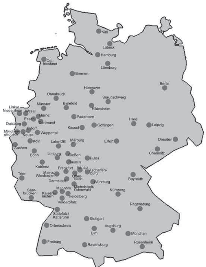
Das Freecycle Netzwerk Deutschland

Die Organisation von Freecycle läuft deswegen auch komplett ehrenamtlich. Es gibt keinen Sponsor, keine Werbemails oder sonstigen nervigen Kram, den man von Internetauktionen sonst gewohnt ist. Weggegeben werden darf dabei